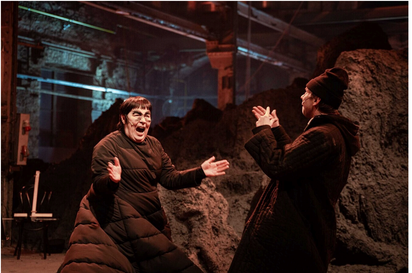
Teater Ekspeditsioon "Leviaatan" (lavastaja Lauri Lagle)