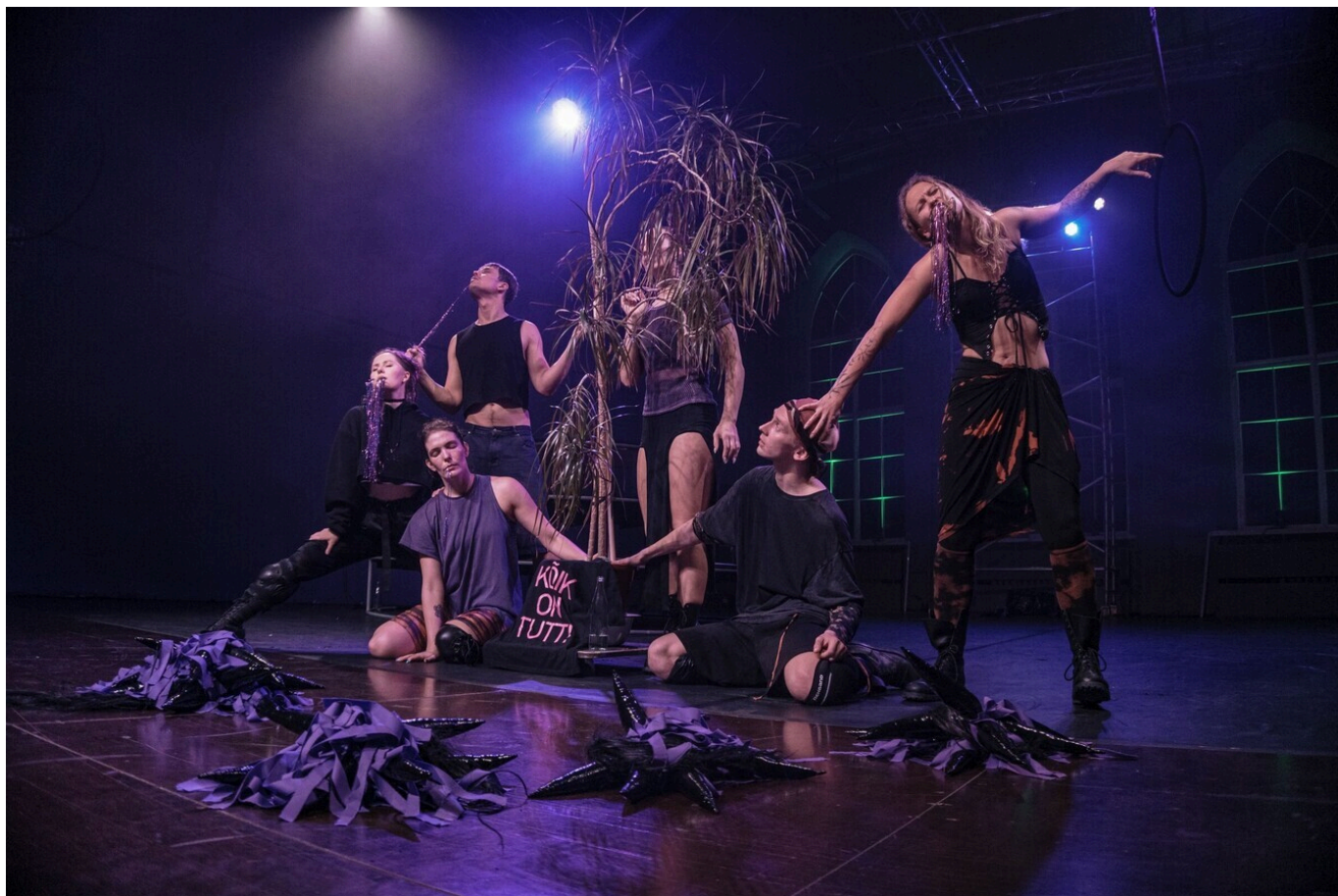
Kanuti Gildi Saal "Sütitajad" (lavastaja Sveta Grigorjeva) Autor/allikas: Kanuti Gildi Saal