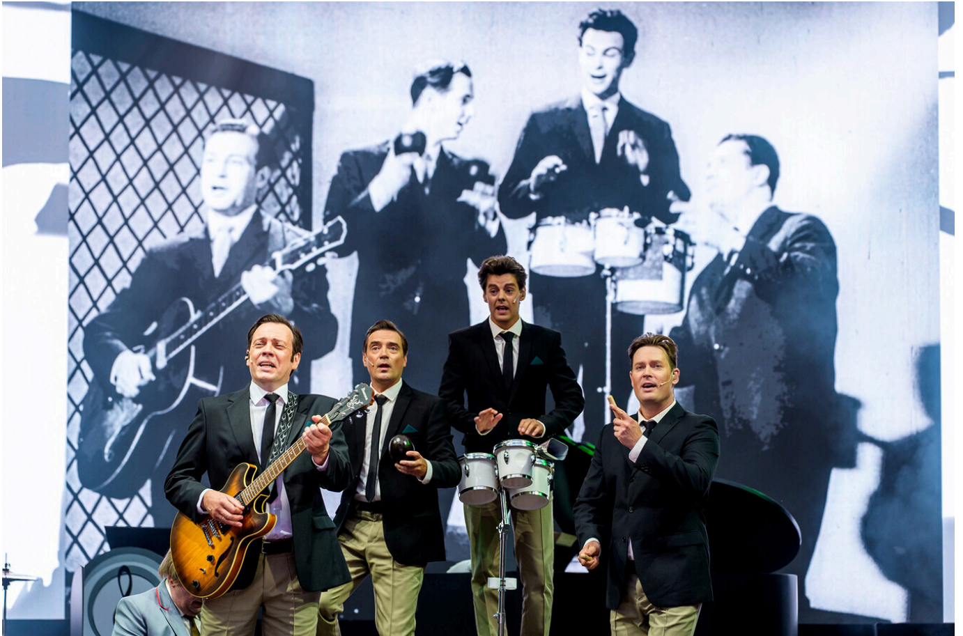
Thors Films "Rohelised niidud" (lavastaja Priit Võigemast)

Autorid Maarek Toompere, Ott Kilusk, Tarmo Kiviväli, lavastaja Priit Võigemast