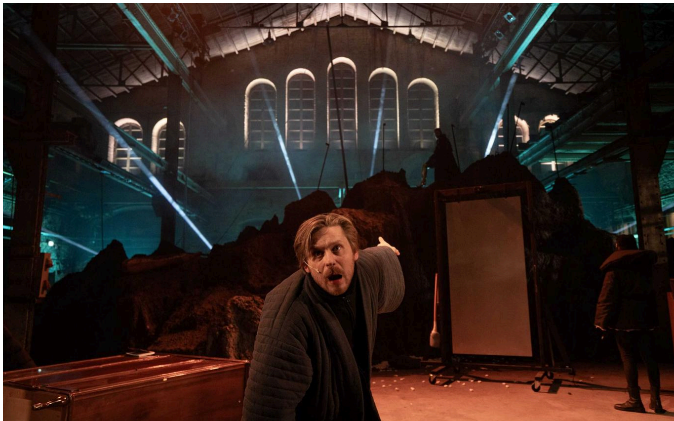
Teater Ekspeditsioon "Leviatan" (lavastaja Lauri Lagle)