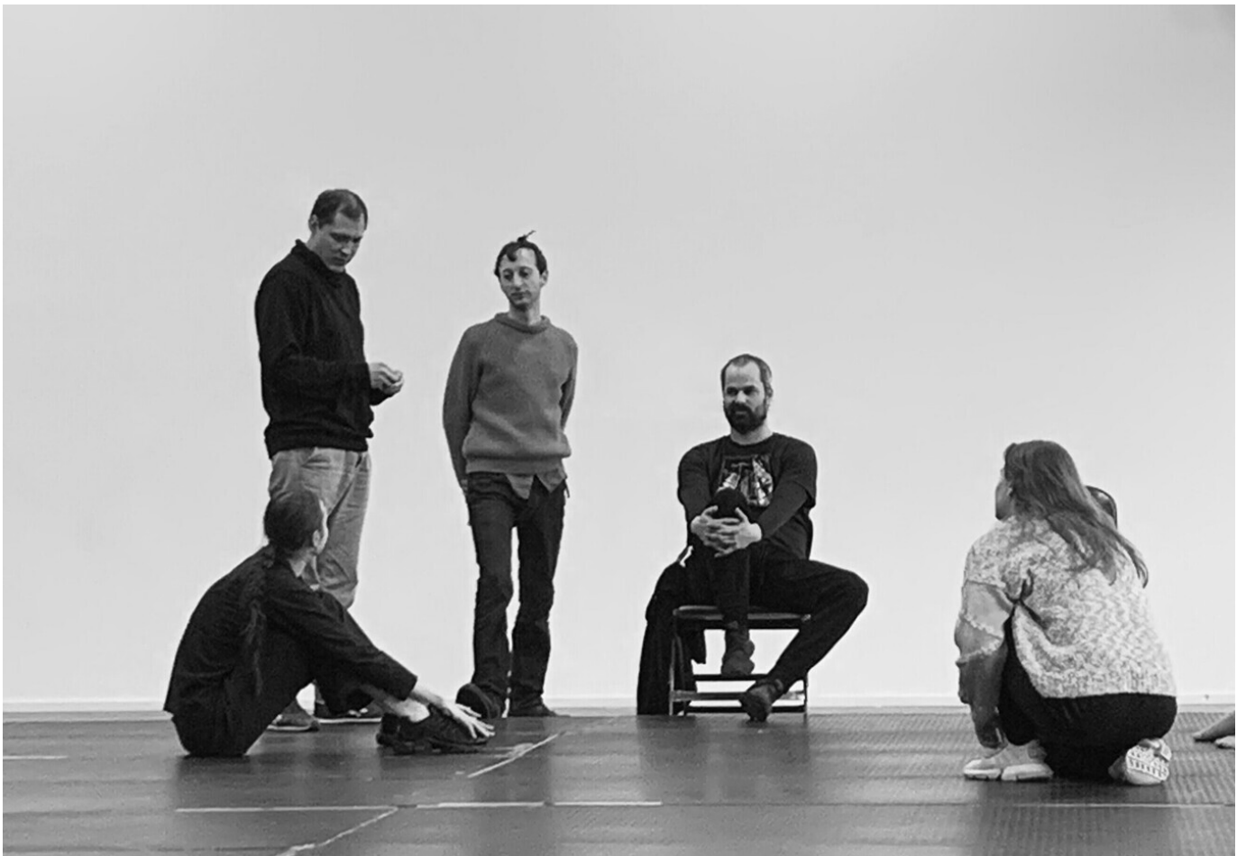
Elektron.art "Küsi minu kehalt" (lavastaja Ruslan Stepanov)

2024. aasta tähelepanuväärseim kodumaine tantsulavastus, mis tõi kokku eri liikumiskeelega vanema ja uuema põlvkonna tantsijad. Väljakujunenud stiiliga etendajad esitamas ja lugemas teineteise kehakeelt – osati kui meelelahutuslik dance battle , teisalt potentsiaalseid koostöövõimalusi avav ja avardav etendus.