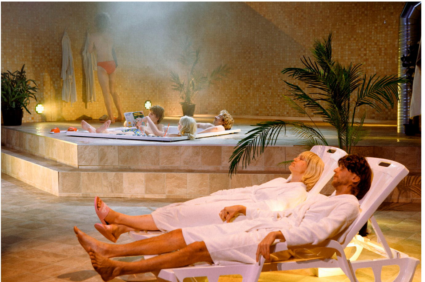
Von Krahli teater "Jussikese 7 sõpra" (trupi ühislooming)

Rõõm Krahli uuest bändist! Lavastus kõnetab ka täpselt õiges ajahetkes. Peenelt punk ja poliitiline!