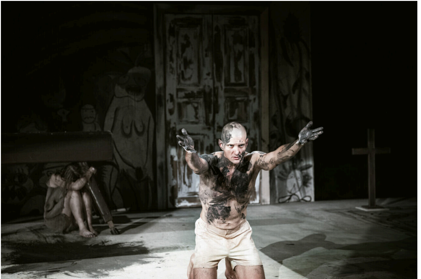
Vanemuine "Päevaraamat" (lavastaja Ringo Ramul)