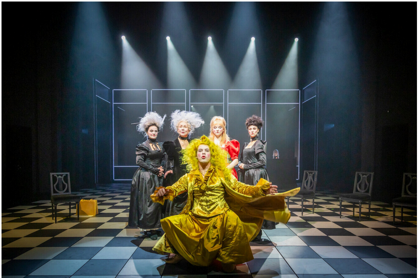
Tallinna Linnateater "Õpetatud naised" (lavastaja Priit Strandberg)