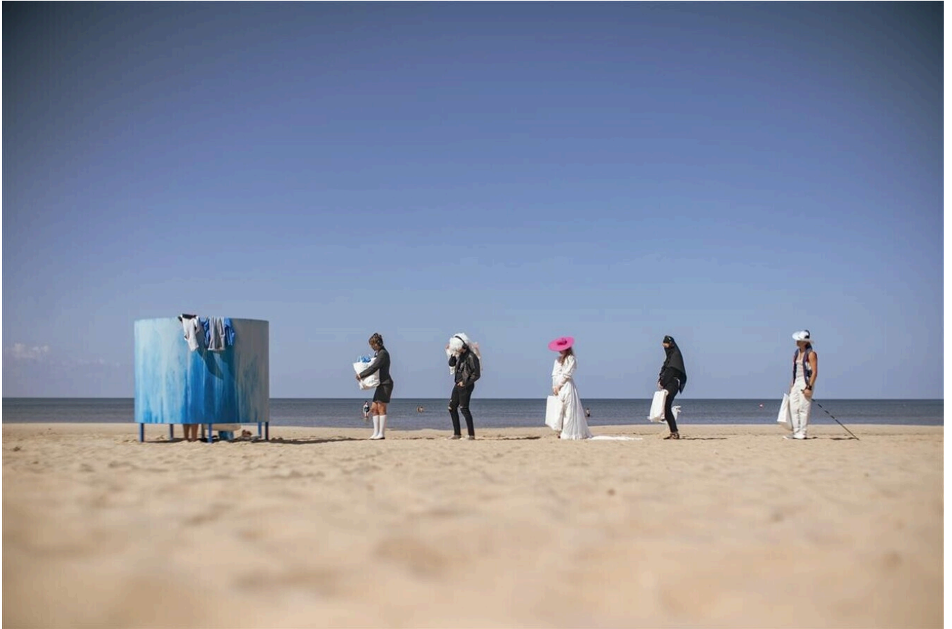
Tartu Uus Teater "Hungerburg 2024"