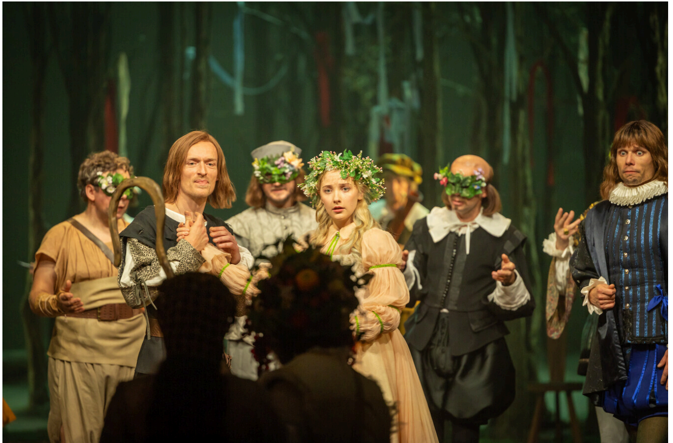
Tallinna Linnateater "Nagu teile meeldib" (lavastaja Uku Uusberg)

"Nagu teile meeldib" on tõeline Shakespeare – naljakas, sügav, filosoofiline. Lavastaja tõi välja kõik tekstis olevad mõtted ja näitas, et maailm on tõepoolest teater ja igaüks mängib siin mõne osa.