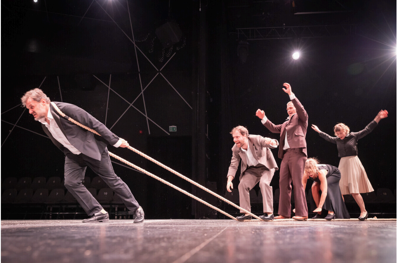
Eesti Noorsooteater "Süüde" (lavastaja Renate Keerd)

Näitlejatöö meistriklass võhmas ja füüsilisuses. Lavastus täis renatelikke (Keerd)käike ja mõistatusi, mis põimuvad kokku üheks avastamisrõõmust pakatavaks tervikuks.