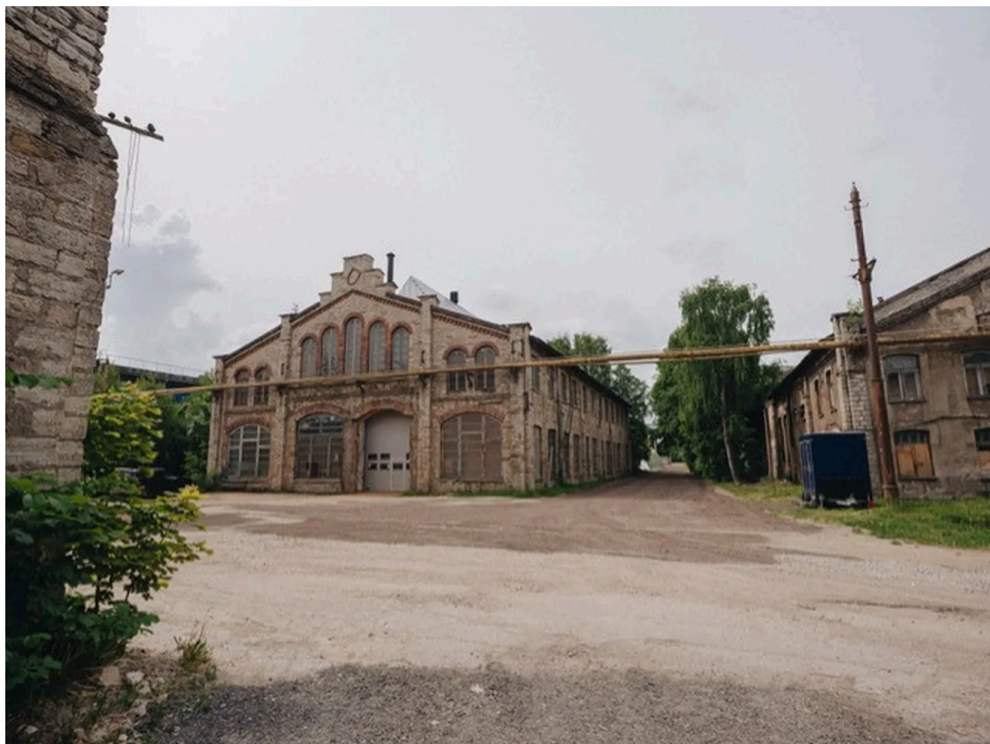
Krulli kvartali remonditsehh.