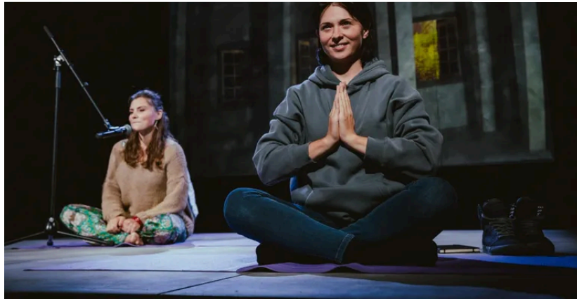
Vaba Lava lavastus «(Elu) sunnitud valikud».