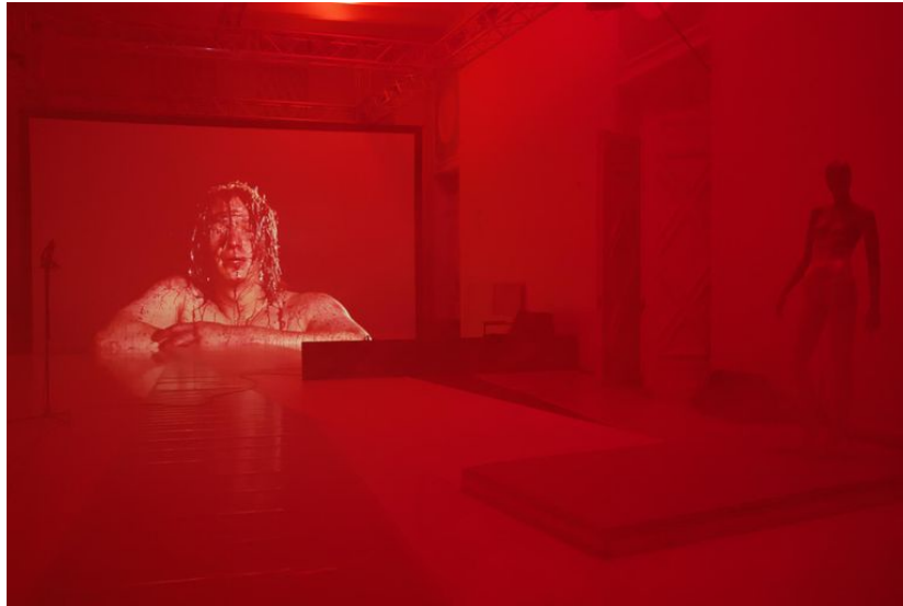
Reha ise seekord etendama ei hakkagi, istub puldis nagu DJ, käivitab järjekordse video- või heli- või tekstiriba, vahel ka valgusšõu.

Eestis pole mõtet ahhetada sõnalavastuse üle, mis tegelikult ruumiinstallatsiooniks osutub. Peavoolu sõnateatris mängivad lavastuskunstnikud suurt rolli, sõnateatri lavakujundused on ruumipoeetilised, Eestis oleks teatrikülastus tihti kunstiline elamus ka siis, kui näitleja üldse lavale ei ilmuks. «Eidosega» on sama lugu. Ruumipoeetilise taotlusega lavastus Eesti peavoolu sõnateatrist ei irdu. Küll aga jääb «Eidose» ruumipoeesia veidi efektiivseks ja väliseks ning lavastuse vormiline dominant on seetõttu hoopis kirjasõna.